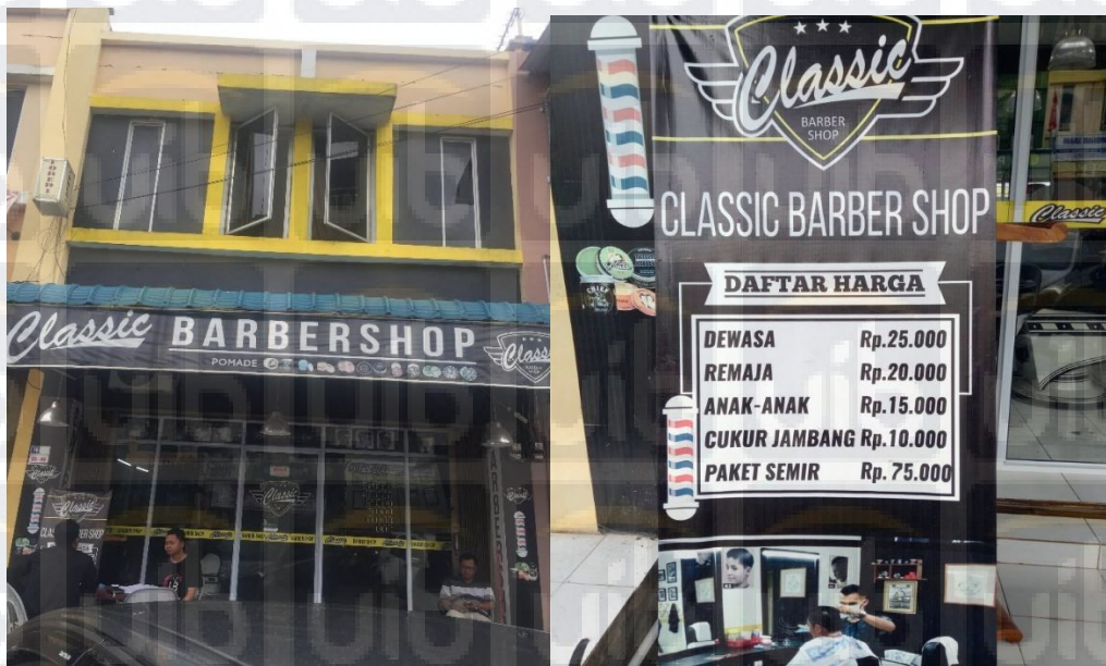
Gambar 1 Tampak depan Classic Barbershop & daftar harga

Adapun daftar harga pangkas di sesuaikan dengan golongan yaitu dewasa, remaja dan anak-anak. Selain itu terdapat daftar lainnya seperti cukur jambang, dan paket semir.