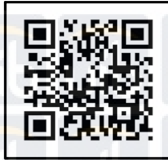
Gambar 2.2 QR (quick response) Code