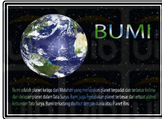
Gambar 2.4 Markerless Marker