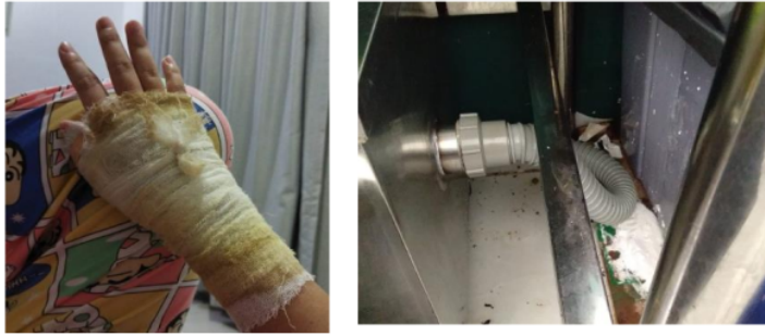
Gambar 1. Kejadian yang terjadi di umkm menantea mitra dua

Karyawan yang bekerja di bidang pengelolaan dan penyediaan makanan dan minuman seringkali terekspos dalam bahaya yang bisa menyebabkan luka pada fisik dikarenakan mereka menghabiskan hampir seluruh waktunya berurusan dengan benda panas dan benda tajam, tanpa pengendalian dan peringatan yang tepat, karyawan bisa berpotensi terkena luka yang sama lagi