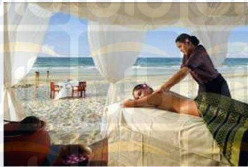
Gambar 2.12 Massage of The Senses