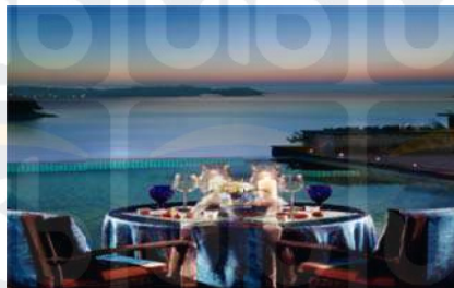
Gambar 2.15 Blue Moon Dinner

Sumber: www.banyantree.com , 5 Oktober 2018