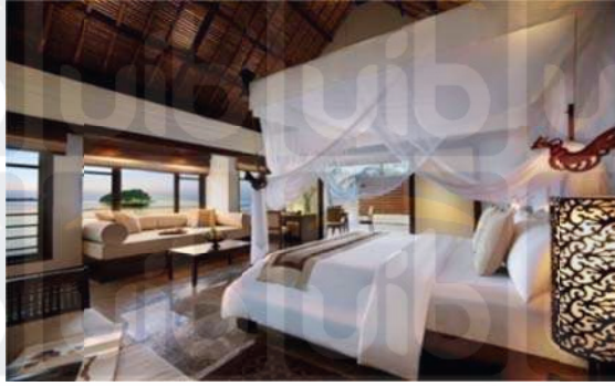
Gambar 2.5 Ocean Villa on The Rock