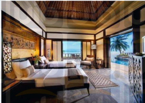
Gambar 2.7 Oceanview Infinity Pool Villa