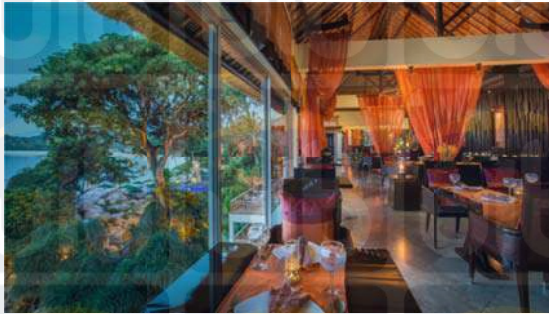
Gambar 2.19 Saffron Restaurant