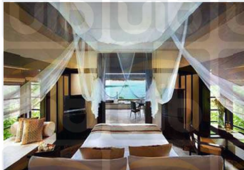
Gambar 2.4 Rainforest Oceanfront Villa