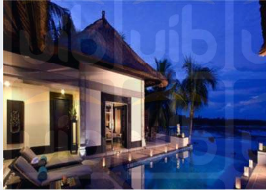
Gambar 2.8 Oceanview Infinity Pool Villa 2 Bedroom