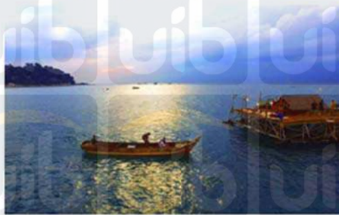
Gambar 2.16 Kelong Dinner

Sumber: www.banyantree.com , 5 Oktober 2018