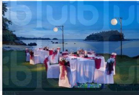
Gambar 2.11 Dinner On 17