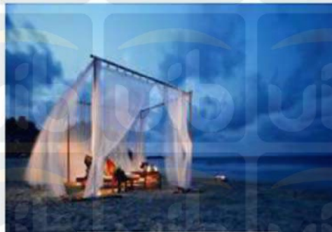
Gambar 2.13 Dinner of the Legend