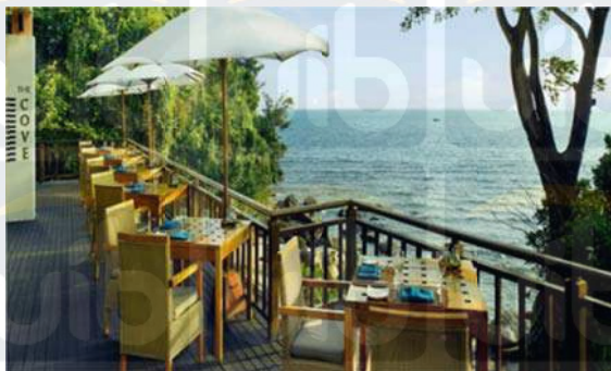
Gambar 2.20 The Cove Restaurant