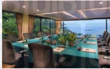
Gambar 2.21 Meeting Room