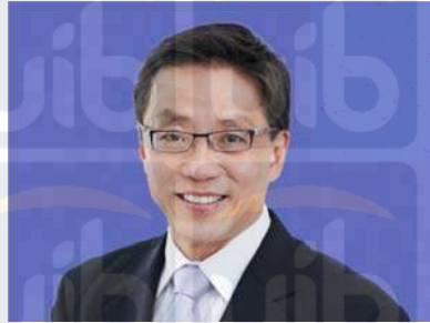
Gambar 2.1 Executive Chairman

pengalaman luar biasa akan membawa kita pada peningkatan mutu yang lebih dimana tamu menjadi tujuan utamanya.