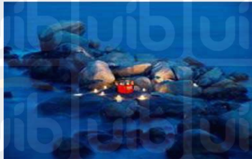
Gambar 2.10 Dinner On The Rock

Sumber: www.banyantree.com , 5 Oktober 2018