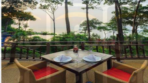
Gambar 2.18 Treetops Restaurant