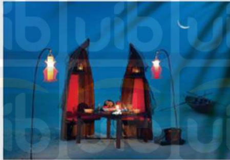
Gambar 2.14 Fisherman Table