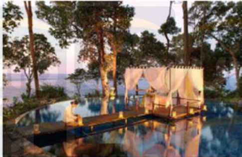
Gambar 2.17 Dinner of the Reflection