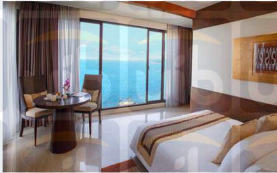
Gambar 2.6 Rainforest Oceanfront Villa 2 Bedroom

Sumber: www.banyantree.com , 5 Oktober 2018