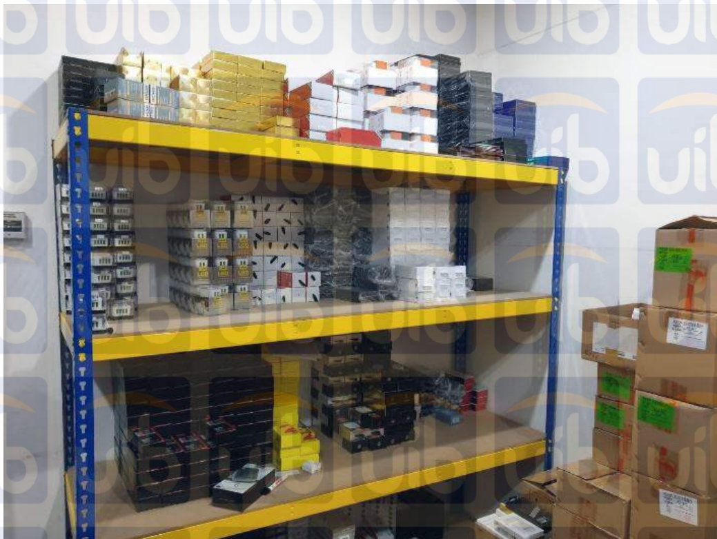
Gambar 1: Gudang Sellindo Accessories

Sellindo Accessories dikelola oleh ownernya sendiri dan dapat dilihat perkembangannya melalui hasil penjualan produknya. Omset pertahun yang dihasilkan oleh Sellindo Accessories ini adalah sekitar kurang lebih Rp. 360.000.000 yang artinya Sellindo Accessories menghasilkan omset sekitar kurang lebih Rp. 30.000.000 setiap bulannya.