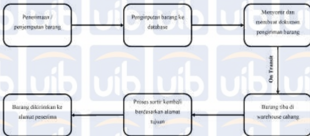
Gambar 2 Flowchart Aktivitas Operasional Perusahaan