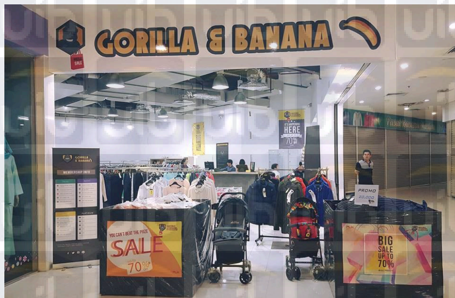
Gambar 3.1 Foto Toko Gorilla & Banana

Toko Gorilla & Banana adalah usaha di bidang ritel yaitu toko yang menjual produk fashion impor. Toko ini menjual berbagai produk fashion seperti pakaian, tas, sepatu, aksesoris dan juga kosmetik serta barang-barang konsumen lainnya. Usaha yang berlokasi di Kepri Mall, Jl. Jendral Sudirman ini dimulai pada tahun 2016.