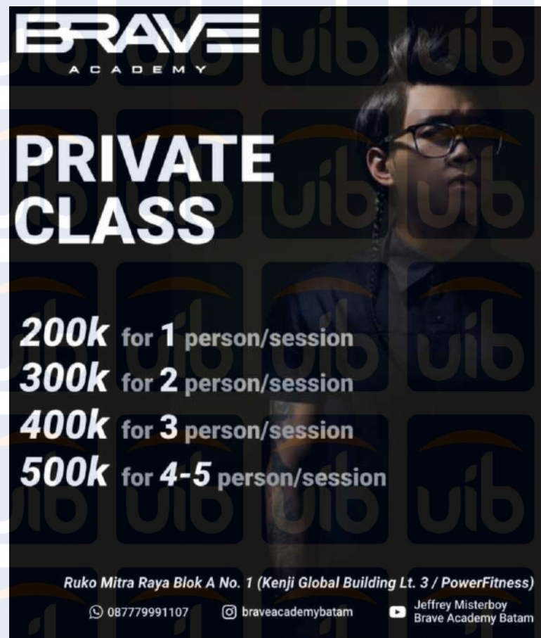
Gambar 3. 2 Daftar Harga kelas Private

Pada Gambar 3.3 merupakan daftar harga untuk kelas terbuka, kelas reguler dan biaya admin yang didesain oleh pemilik. Daftar harga kelas tersebut yaitu: