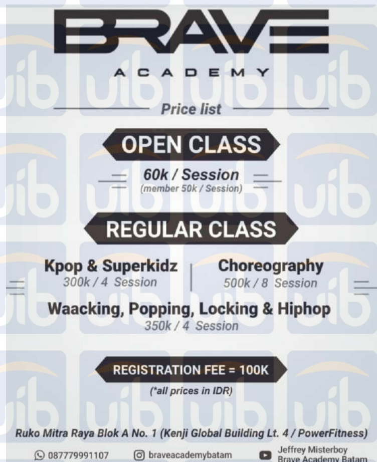
Gambar 3. 1 Daftar Harga Kelas