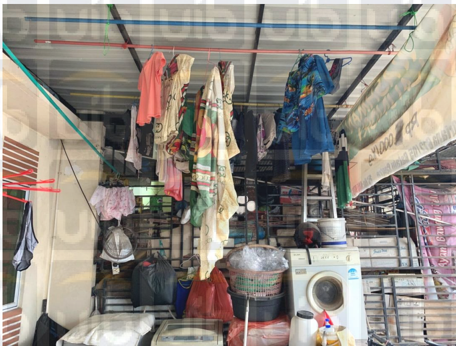
Gambar 3.3 Aktivitas Operasional Washman Laundry

Usaha jasa Washman Laundry melayani pencucian pakaian, sprei, dan boneka yang sama seperti pelayanan pada laundry-laundry umumnya. Pada tahap awal aktivitas usaha jasa laundry ini dimulai dari penimbangan pakaian, boneka maupun sprei pelanggan yang ingin di cuci. Penimbangan pakaian, boneka dan sprei dilakukan dengan tersendiri karena memiliki harga yang berbeda-beda. Kegiatan selanjutnya yang akan dilakukan setelah penimbangan adalah pencucian, pengeringan, penyetricaan dan pengemasan. Kebanyakan pelanggan Washman Laundry merupakan masyarakat yang bertempat tinggal di Perumahan Oriana.