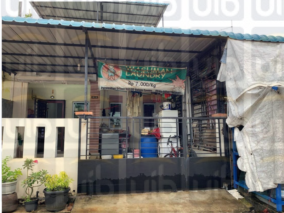
Gambar 3.1 Lokasi Washman Laundry