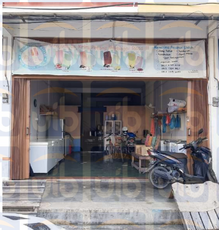
Gambar 2 Tampak Depan Espotam Moex

Espotam Moex sekarang beranggotakan 4 karyawan tetap dan dibantu oleh beberapa karyawan harian dari Espotam Moex yang beranggota 6 orang.