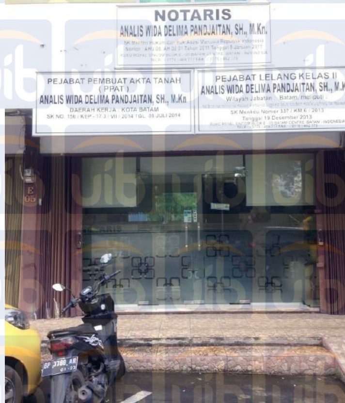
Gambar 3.1 : Kantor Notaris