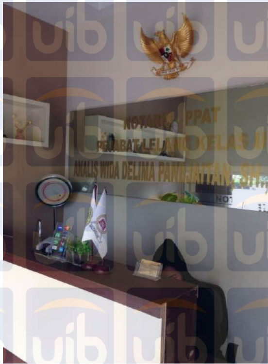
Gambar 3.3 : Kantor Notaris