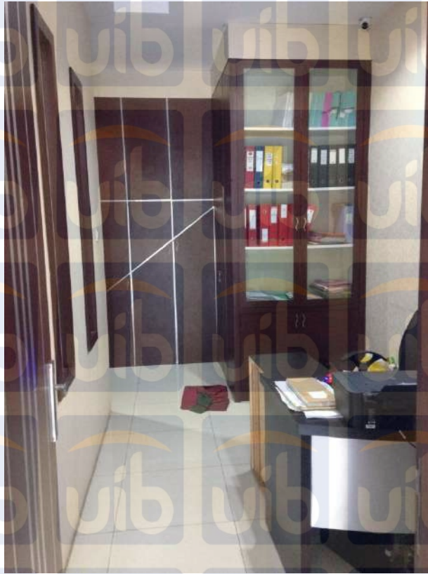
Gambar 3.5 : Kantor Notaris