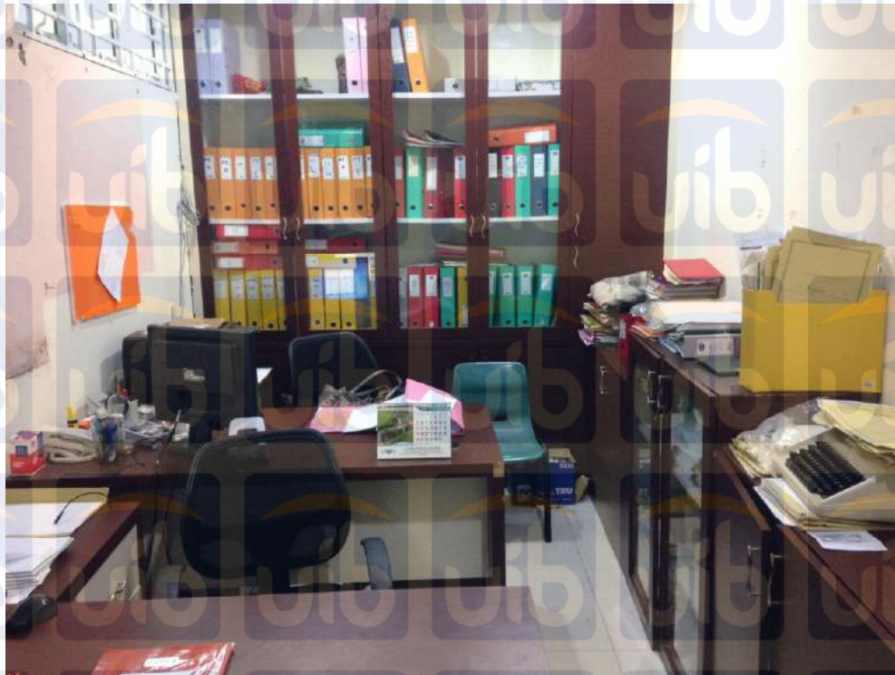
Gambar 3.6 : Kantor Notaris