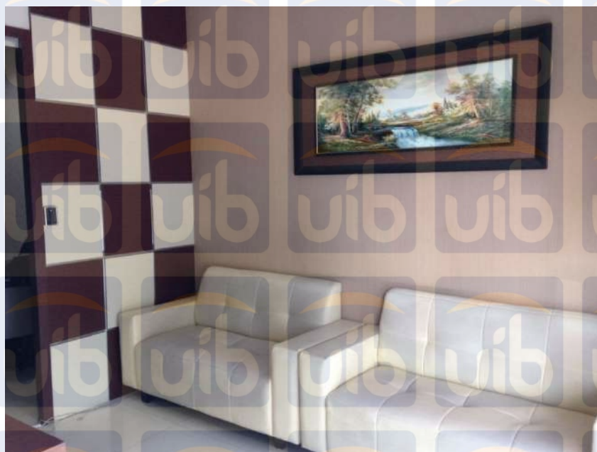
Gambar 3.2 : Kantor Notaris