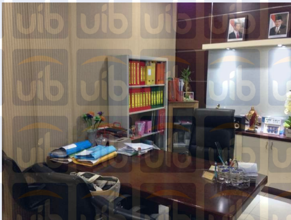
Gambar 3.4 : Kantor Notaris