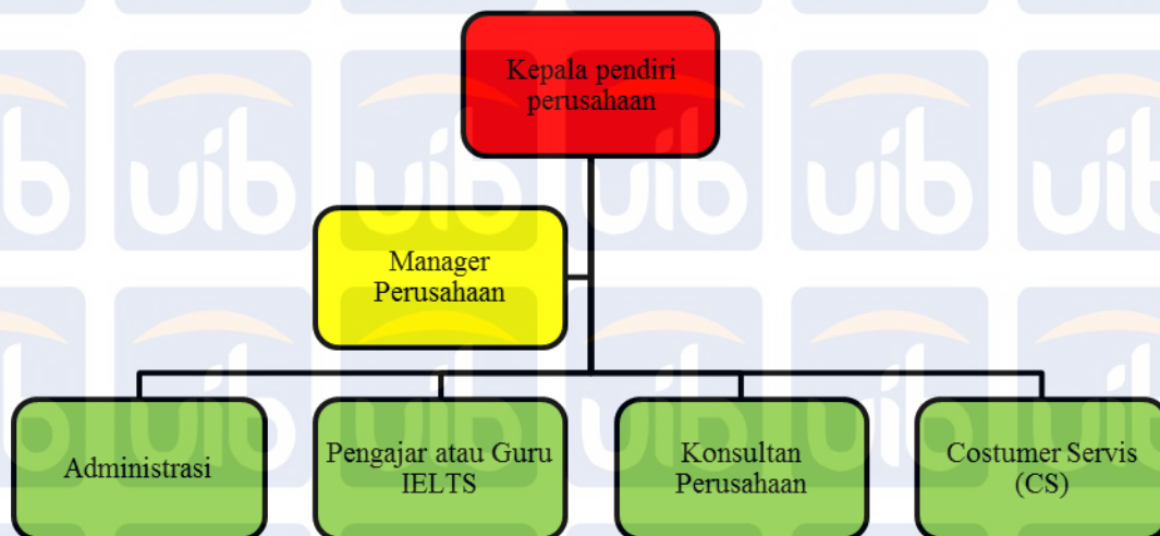
Gambar.3.1 Struktur Organisasi Perusahaan