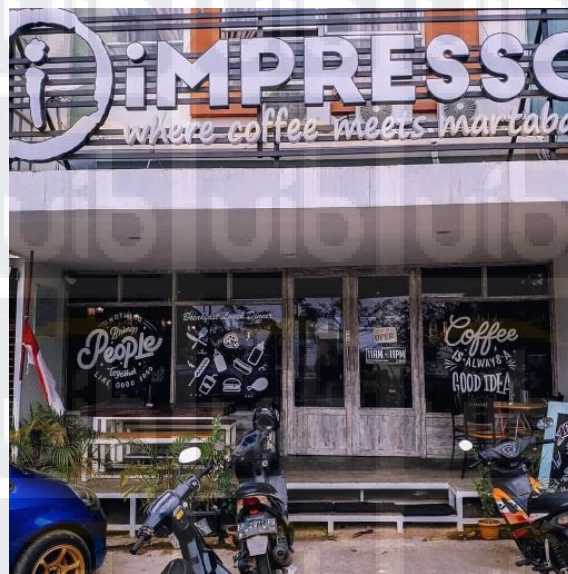
Gambar 3.2 Impresso Coffee

Perusahaan berikut juga bergerak di bidang kuliner yang berupa cafe yang memiliki ciri khas melalui makanan yang ditawarkan yaitu martabak ditemani minuman yang disediakan berupa kopi sesuai dengan slogan cafe tersebut yaitu “ where coffee meets martabak ” tetapi dengan berbagai macam varian rasa. Selain itu Impresso Coffee juga menyediakan makanan lain seperti nasi goreng, pasta , chicken wing , dan sebagainya. Begitu pula dengan menu minuman selain kopi yaitu berupa varian mocktail yang sangat menarik dengan harga yang sangat terjangkau mulai dari Rp 10.000 hingga Rp 90.000 untuk menu makanan dan minuman yang tersedia.