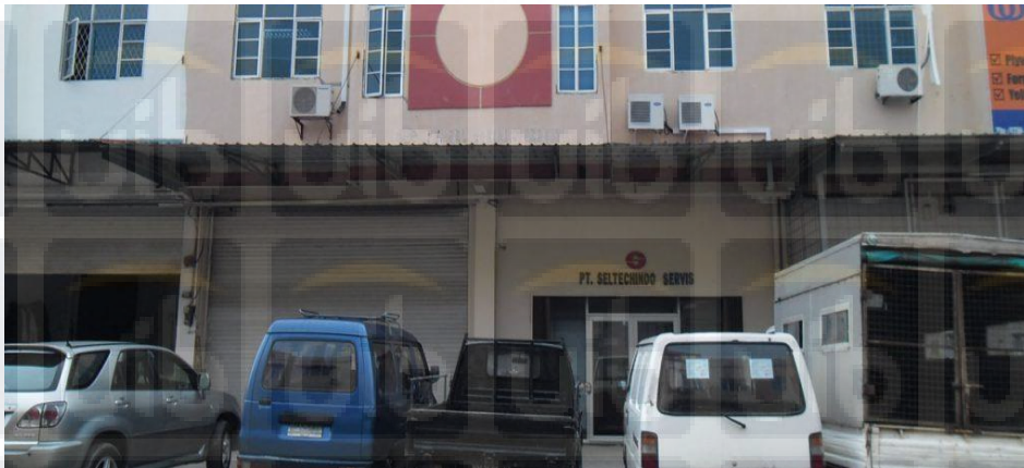
Gambar 3.1 PT. Seltechindo Servis

PT. Seltechindo Servis merupakan sebuah perusahaan yang bergerak dalam bidang maintenance equipment HVAC seperti Chiller, AHU, Clean Room , dan sebagainya pada perusahaan customer. Perusahaan ini didirikan pada bulan Juni 1991 di Batam yang beralamat di Komp. Inti Batam Business & Industrial Parks, Batam, Riau, 29433, Sei-Panas, pada awal berdiri PT. Seltechindo Servis merupakan perusahaan lokal dengan managernya berasal dari Singapore pada tahap awal. PT. Seltechindo Servis di dirikan terutama memberikan layanan servis kepada chiller brand Carrier yang dipasang di Batam, khususnya di Taman Industri Batamindo. Dengan kata lain, PT. Seltechindo Servis adalah perpanjangan dari Carrier Service Centre dari Carrier Singapore Pte Ltd.