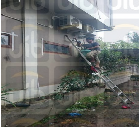
Gambar 3.3 Mengisi refrigerant

Mengisi refrigerant mengikuti tipe AC yang digunakan, untuk tipe AC pada umumnya, dapat diisi menggunakan refrigerant bertipe R-22, tipe refrigerant R-410A dapat mengisi AC yang bertipe inverter , untuk refrigerant bertipe R-32 khusus AC merek Daikin .