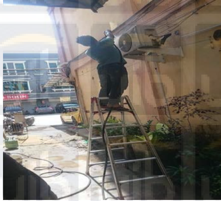
Gambar 3.2 Mencuci Outdoor Air Conditioner (AC)

Pembersihan menggunakan penyemprotan cairan chemical di evaporator untuk memudahkan pembersihan kotoran dan debu yang melekat.