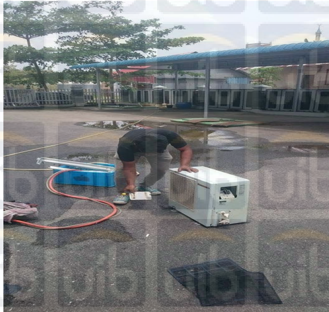
Gambar 3.4 Pencucian outdoor unit yang sudah dibongkar

dengan menutup sumber tahanan pada AC, kemudian membongkar outdoor , yang dilakukan utama ialah melepaskan dan menutup pipa kapiler menghubungkan ke katup ekspansi supaya refrigerant tidak terjadi kehabisan.