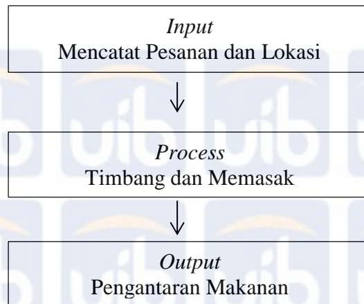
Gambar 2 Aktivitas Kegiatan Perusahaan Operasional UKM Ketupat Gulai Pakih

Proses input dimulai dengan datangnya pelanggan dan pesanan yang harus dicatat oleh karyawan penerima pesanan, setiap pesanan lontong ketupat yang diinginkan harus sesuai dengan pesanan pelanggan. Makanan tersebut kemudian dibuat oleh pemilik usaha makanan yang dipesan oleh pelanggan, kemudian makanan diantar oleh karyawan penerima pesanan makanan kepada pelanggan yang memesan makanan tersebut.