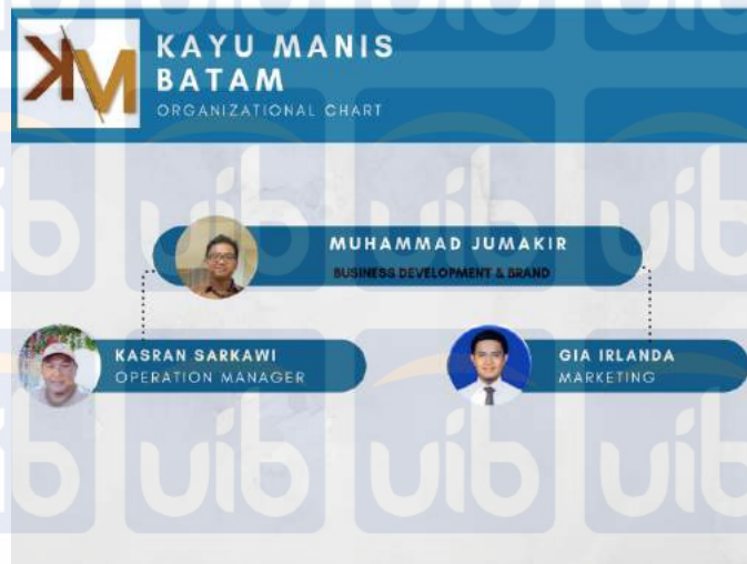
Gambar 2: Struktur organisasi Kayu Manis Batam, Sumber: Penulis (2019)