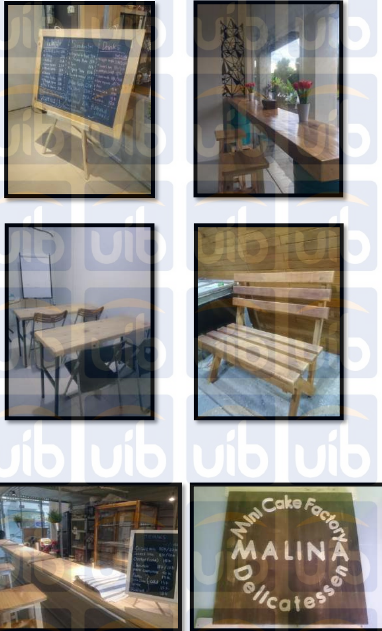
Gambar 3: Contoh pembuatan interior dan wood customs dari kayu manis, Sumber: Penulis (2019).