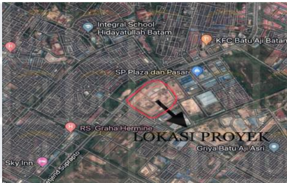
Gambar 3.1 : Peta Lokasi Proyek