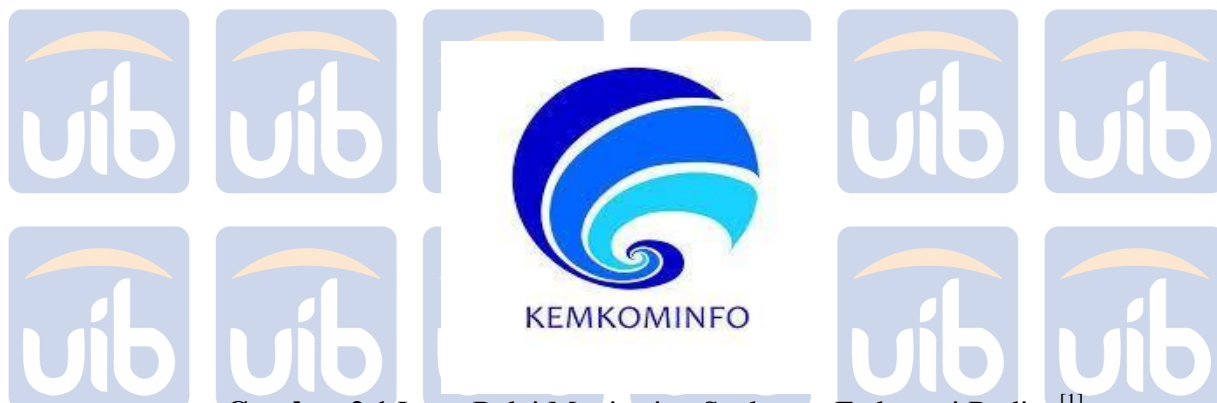
Gambar 2.1 Logo Balai Monitoring Spektrum Frekuensi Radio. [1]