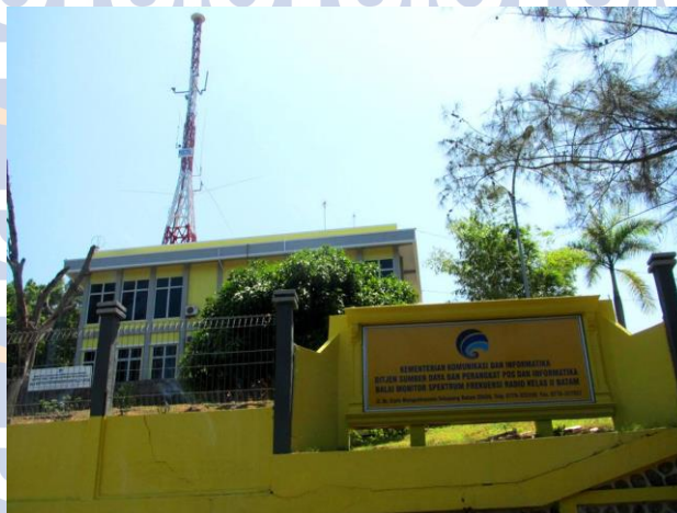
Gambar 2.4 Gedung Lokasi Kerja Praktek [4]

Gedung Lokasi Kerja Praktek cabang Sekupang batam.