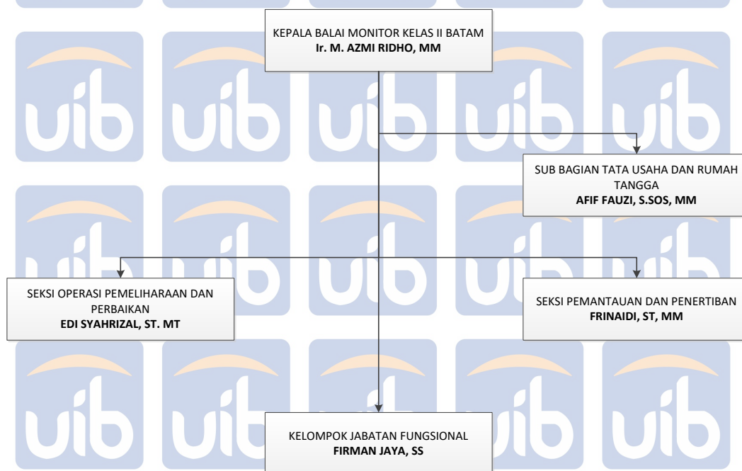
Gambar 2.2 Flow Chart Struktur Organisasi Balai Monitor Kelas II Batam. [2]