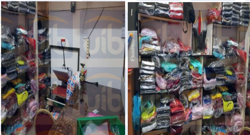
Gambar 3.3 Aktivitas Operasional Zunith.ID, Sumber: Penulis (2019).

Zunith.ID merupakan sebuah usaha UMKM yang bergerak di bidang usaha konfeksi baju. Aktivitas dari Zunith.ID berupa penerimaan Admin Media Sosial yang bertugas sebagai penerima pesanan dari pelanggan, jika telah mendapatkan pesanan baju dari pelanggan maka Admin Media Sosial akan memberikan pesanan kepada Staff Admin Editing untuk merancang gambar sesuai dengan apa yang di pesan dari pelanggan, setelah itu setelah selesai membuat rancangan baju maka hal yang selanjutnya akan di serahkan kepada Staff Print Baju dan akan di cetak baju sesuai dengan pesanan dari pelanggan. Setelah semua proses pencetakan baju sudah selesai maka akan di antar pesanan oleh Admin Media Sosial melalui media Gojek. Jam operasional Zunith.ID adalah Senin sampai Sabtu dimana Senin sampai Jumat beroperasi dari jam 08:00 sampai 17:00 dan Sabtu beroperasi dari jam 08:00 sampai 14:00, libur setiap tanggal merah dan hari Minggu.