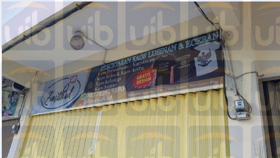
Gambar 3.1 Kantor Zunith.ID, Sumber: Penulis (2019).

Bapak Wiriya mendirikan Zunith.ID pada pertengahan Juli tahun 2017, Zunith.ID sendiri beralamat di Komplek Baloi Abadi blok B no 6. Zunith.ID sendiri adalah usaha yang bergerak di bidang konfeksi baju. Baju yang yang di tawarkan oleh Zunith.ID beraneka ragam, dapat dipesan dalam bentuk lusinan maupun eceran. Zunith.ID beroperasi pada hari Senin sampai hari Sabtu dimana jam operasional Senin sampai Jumat dari jam 8 pagi hingga 5 sore dan hari Sabtu dari jam 8 pagi hingga 2 siang, dan mempunyai karyawan sebanyak 2 orang. Konsep dari Zunith.ID adalah konfeksi baju yang menawarkan penyediaan pemesanan untuk kaos perusahaan, kaos acara formal dan nonformal untuk keluarga. Rata-rata omzet Zunith.ID berada di kisaran Rp.200.000.000/ tahun dan memiliki aset berkisar Rp.100 juta–Rp.130 juta.