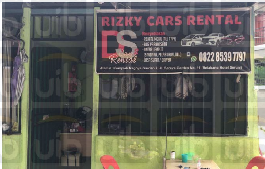
Gambar 2 Rizky Cars Rental, sumber: Data diolah, 2019.

Usaha Rizky Cars Rental dibentuk pada 15 juni 2015 oleh Restu Hasan. Usaha ini bergerak pada bidang jasa penyewaan mobil jika sedang berkunjung ke Batam. Rizky Cars Rental berlokasi di Komplek Nagoya Garden 2, Jl. Seraya Garden No. 11 (belakang hotel seruni). Saat ini Rizky Cars Rental memiliki 3 anggota untuk menjaga toko ataupun mengantar tamu secara bergiliran.